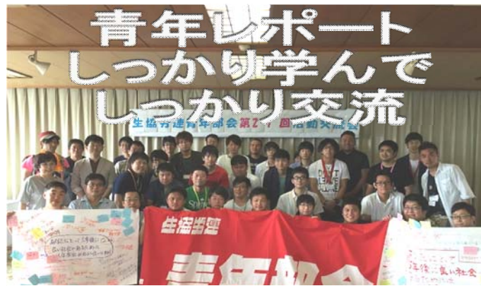
生協労連青年部交流集会 最終日にみんなで記念撮影