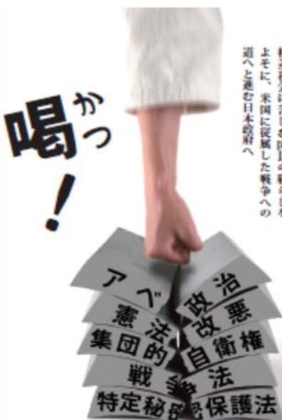
格差社会に苦しむ国民の暮らしをよそに、米朝に突進した戦争への道へと進む日本政府へ

7月10日(日)は参議員選挙投票日です。今回の選挙が歴史的だと言われている理由は、憲法が守られ、憲法に基づく政治を取り戻すかどうか、つまり、民主主義の根幹が問われている選挙だからです。だからこそ、主張の違いを超えて野党と市民が団結し、32の1人区で統一候補を擁立し、改憲の条件となる残る参議院での2/3以上の議席を与党に取らせないと頑張っているのです(衆議院ですでに2/3以上)。