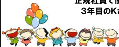
正規社員で働いて 3年目のKさん

同世代の3人に1人は非正規雇用です。僕も大学院を卒業後、新卒で正規に雇われましたが、給料は手取りで19万円程。これには固定残業代も入っています。これならもっと割りのいいアルバイトもあるんじゃないかと考えてしまいます。ある友人は正規職員で就職してから、10年先輩の給料明細を見る機会があって、自分とほとんど変わらないと分かったそうです。未来がないと思って辞めたと言っていました。正規でも非正規でも違いはなくなっているように感じます。ちゃんと働けばちゃんとお金がもらえて、文化的な生活が出来る社会になってほしいです。