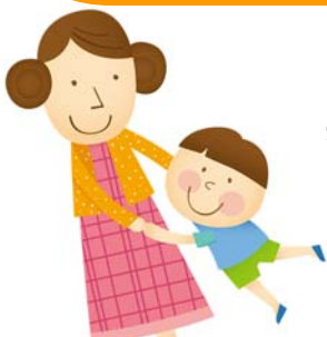
30歳Uさん。 夫と2歳の長男との 3人暮らし。

知り合いに自衛隊員がいます。とってもいいやつで、災害の時なんかは早く救援に行かなくちゃって話してくれます。でも、昨年強行された安保法制は、ホント不安です。本人は何も言わないけれど、その家族は不安な気持ちを吐露してくれました。だって、日本が攻められてなくても、海外へ派兵され、軍事支援をすることになるんでしょう。当然相手の標的になっちゃいますよね。