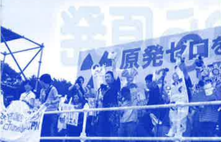
2011.7.2 原発ゼロをめざす7・2緊急行動

この決定は、電力会社や原発関連大企業の利益を優先し、国民のいのちと生活を危険にさらすものであり、断じて許されるものではありません。原発ゼロの決断を政府にせまるオールジャパンの集会として成功させましょう。