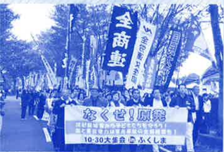
2011.10.30 なくせ原発10・30大集会 in 福島