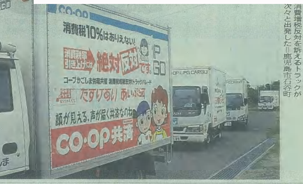
消費増税反対を訴えるトラックが次々と出発した。鹿児島市石谷町