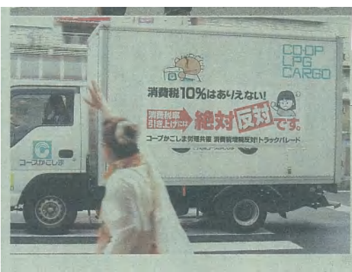
消費増税反対をアピールしながら走る配送用トラック=2日、鹿児島市

トラック57台 横断幕で訴え 鹿児島 生協コープかごしま労働組合と生活協同組合コープかごしまは2日、「消費増税反対」を掲げ、トラックパレードと署名活動を鹿児島市でおこないました。「消費増税には絶対反対です」と横断幕をつけた配送用トラック57台が約2時間かけ、増税反対をアピールしました。